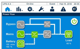
5-дюймовый сенсорный экран с дружелюбным интерфейсом

Любые технические характеристики могут быть изменены без предварительного уведомления.