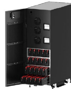
Модели со встроенными батареями и возможностью замены батарейных лотков