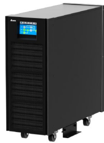
Исполнение IP42 по дополнительному заказу